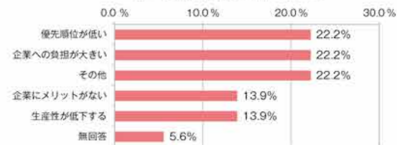
図4 取り組む必要がない理由 (N=26)

取り組む必要がないと回答した事業所は「企業への負担が大きい」「優先順位が低い」各22.2%等 (図4) と回答しており、企業におけるワーク・ライフ・バランスに対する意識に差があるようだ。