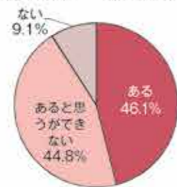
図1 ワーク・ライフ・バランスに取り組む必要性 (N=317)

企業において「ワーク・ライフ・バランス」に取り組む必要が「ある」が46.1%、「あると思うができていない」が44.8%と同程度となった。取り組む必要が「ない」が9.1%となった。