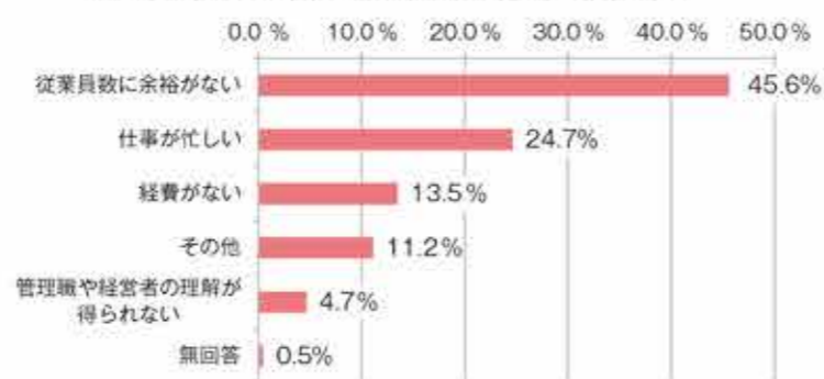
図3 取り組む必要はあるができていない理由 (N=215)

取り組む必要はあるができていないと回答した事業所は、その理由として「従業員数に余裕がない」が45.6% (図3) と最も多かった。