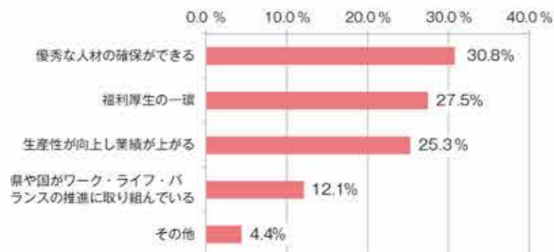
図2 取り組む必要がある理由 (N=273)

回答した事業所は「優秀な人材の確保ができる」30.8%、「福利厚生の一環」27.5% (図2) という理由からワーク・ライフ・バランスに取り組む必要があるとした。