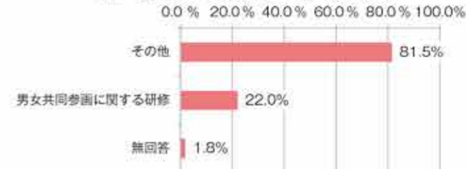
図6 実施している社員研修の内容 (N=168)

調査結果の詳細は、当センターホームページに掲載している報告書をご覧ください。今回の調査にご協力いただきました企業の方々に対し、感謝申し上げます。