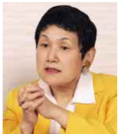
内閣府男女共同参画局 局長 坂東眞理子氏 富山県生まれ。昭和44年東京大学卒業、総理府入府 青少年対策本部、婦人問題担当室、老人対策室、内 閣広報室参事官、統計局消費統計課長などを経て、 平成5年～平成7年男女共同参画室長、平成7年～ 平成10年埼玉県副知事、平成10年～平成12年ブリス ベン総領事、平成12年～現職