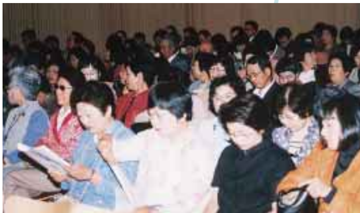
県内各地から大勢の方たちがつめかけ、大盛況でした。

人間としての力を持った、自立した個人をつくるのが、男女共同参画社会の基本です。自立した個人、一人ひとりが力を合わせて男女共同参画社会を創るの