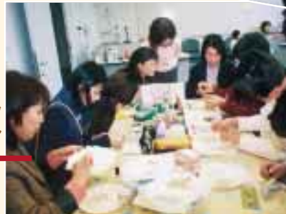
センターの各研修室でさまざまなワークショップが行われました