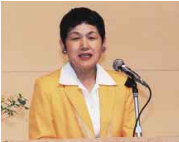
坂東局長から目指すべき男女共同参画社会について講演いただきました。

しかし、一番の問題は、この一人ひとりが持っている力が、せっかくエンパワメントした力が、十分社会に還元されているかどうか、他人の役に立っているかどうか、ここに、大きなギャップがあることではないかと思えます。今、それを発揮できる仕組みが、求められているのです。