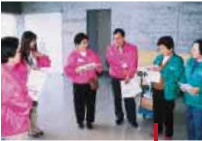
フェスティバル実行委員会の方とセンターボランティアの方との開場前の綿密な打ち合わせ風景です