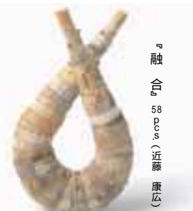
融 合 58 p.p.s. (近藤 康広)