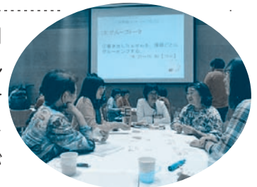
ネットワークカフェの様子

「男女共同参画基本法から15年が経ち、なぜ、男女共同参画が進まないのか」をテーマにグループで話し合いました。「家族や地域ではまだまだ男女共同参画意識が根付いていないと感じる」「若い世代の人から男女共同参画を学ぶことができたらいと思う」など、活発な意見交換が行われました。