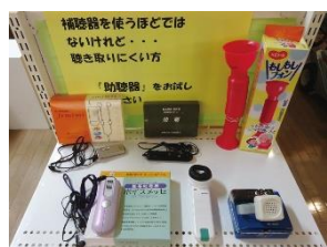
聴き取りにくい方に