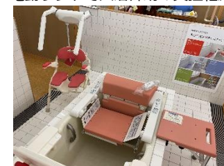
電動リフトで入浴介助の負担軽減