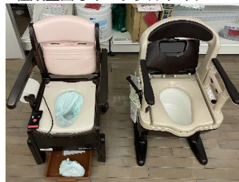
種類豊富なポータブルトイレ