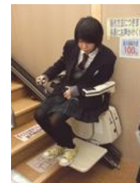
安全な昇降で行動範囲も広がる