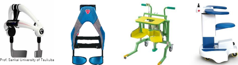
介護負担を軽減する「介護支援ロボット」を体験できます（毎月第3水曜日予定）

Prof. Sankai University of Tsukuba / CYBERDYNE Inc.