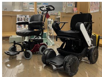
電動車いす（介助用・次世代型）