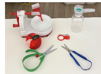
すべての人の安全・使いやすさに配慮