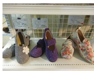
おしゃれで履きやすく履かせやすい