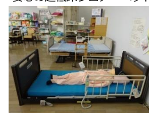
安心の超低床フロアーベッド

福祉機器展示室では600点以上の福祉用具を展示しています。また、高齢者の方が安心して暮らせる「高齢者モデル室」も備えています。